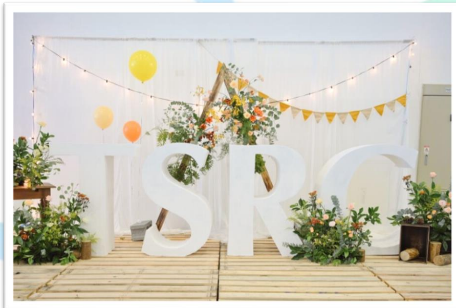
<< 台橡員工 50 周年家庭日 >>